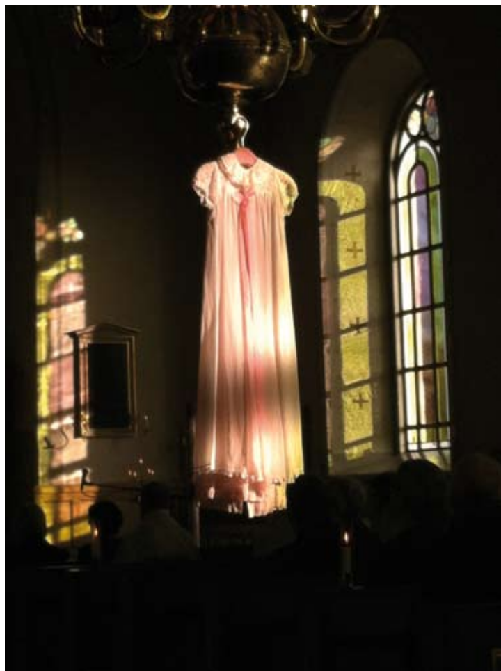
Dopkläningen är en av de symboler som vi förknippar med dop.

Tradition - När Jesus är runt 30 år går han till Johannes Döparen vid floden Jordan. Johannes döper då Jesus. Efter detta börjar Jesus med sitt uppdrag, att gå runt i landet och berätta för människor om Gud. Innan Jesus läm-