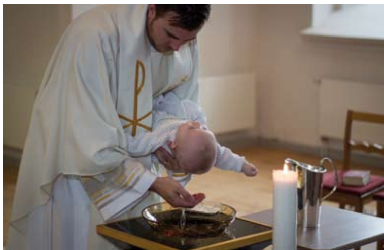
Barndop i Rödeby kyrka.