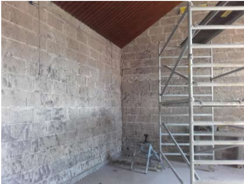
Väggarna putsas och målas om i kapellet.