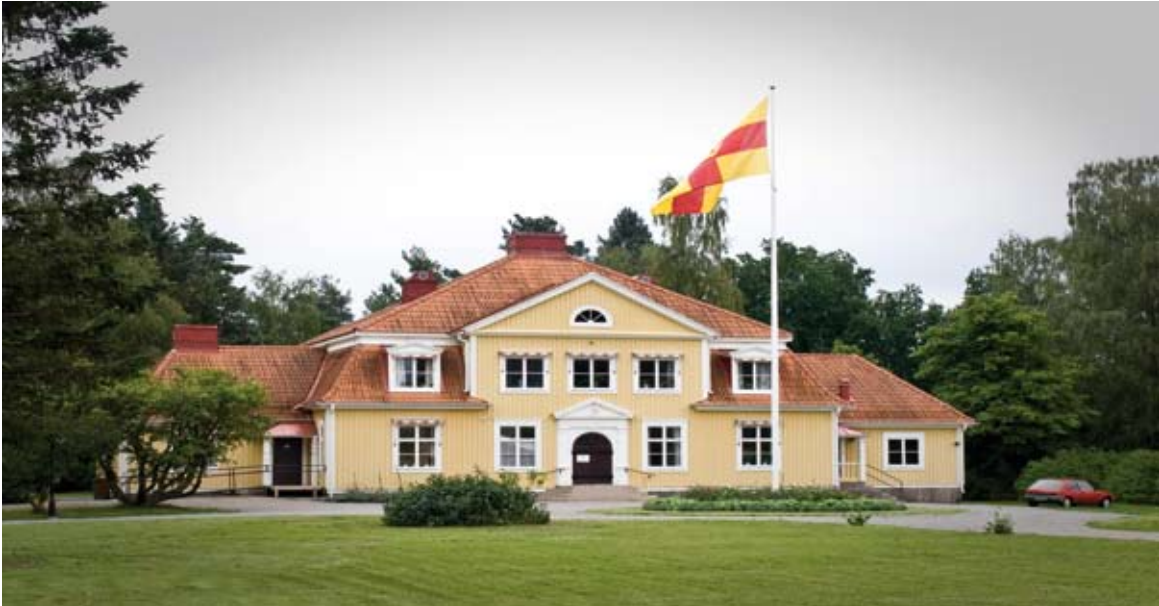
En av församlingens fastigheter är prästgården med expedition och kontor.