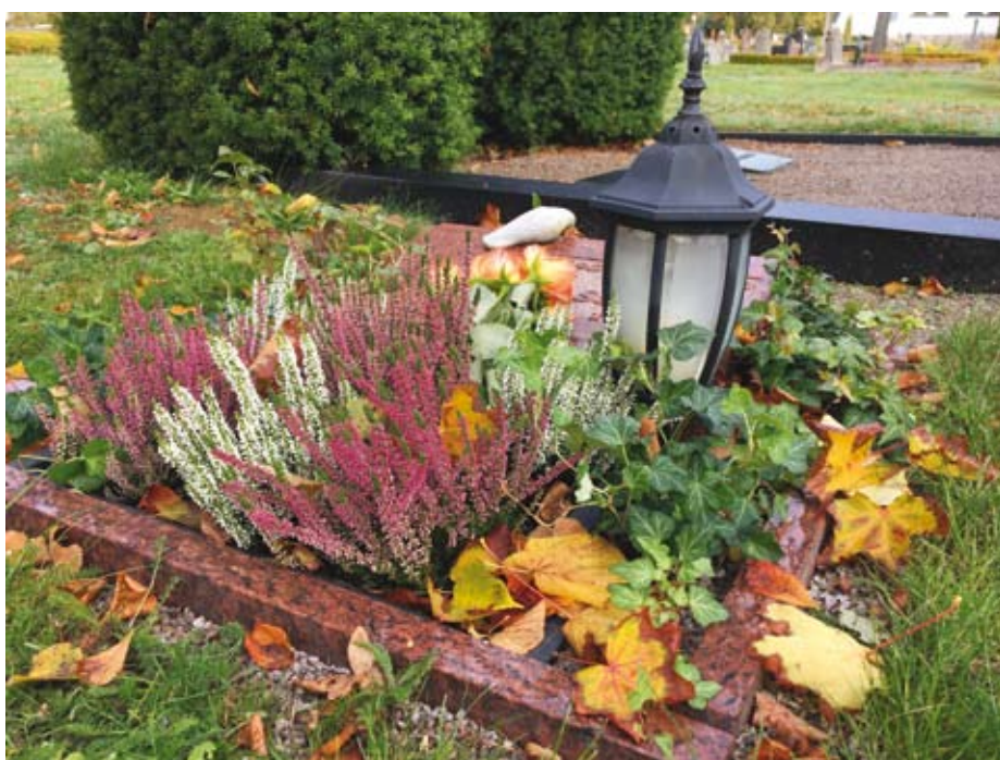
Det finns många olika gravskick på Rödeby kyrkogård.