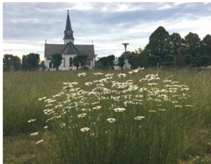
I somras möttes man som besökare på kyrkogården av små ängar här och var.