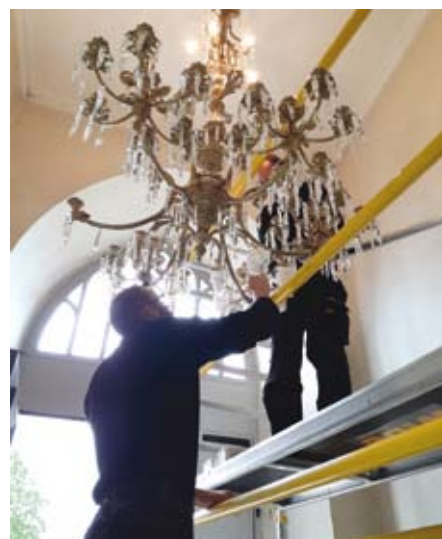
Ljuskronan hängs upp i vapenhuset.

Nu pryder denna magnifika krona återigen kyrkan, närmare bestämt vapenhuset.