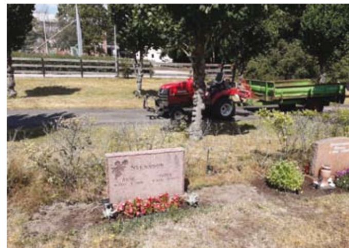
De buxbomshäckar, på östra kyrkogården, som varit i dåligt skick har tagits bort under sommaren.