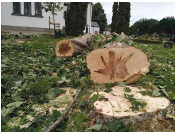
Några av träden i allén, med djup röta i stammen, som togs ned i slutet av sommaren.