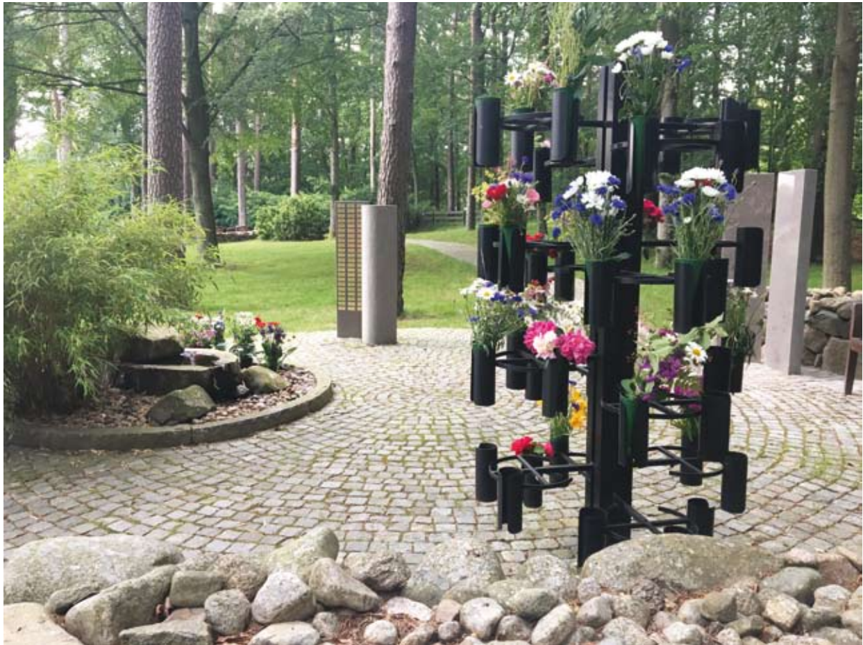
Askgravlunden på Rödeby kyrkogård.