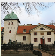
Örgryte gamla kyrka Örgryte församling Danska vägen