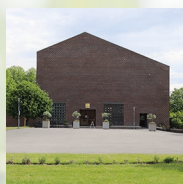
Härlanda kyrka Härlanda församling Härlandavägen 23