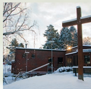
Björkekärrens kyrka Björkekärrens församling Sorensens gata 1