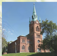
Sankt Pauli kyrka Sankt Pauli församling Mäster Johansgatan 1