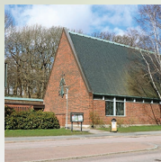
Skårs kyrka Örgryte församling Skårgatan 23