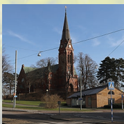
Örgryte nya kyrka Örgryte församling Herrgårdsgatan 2