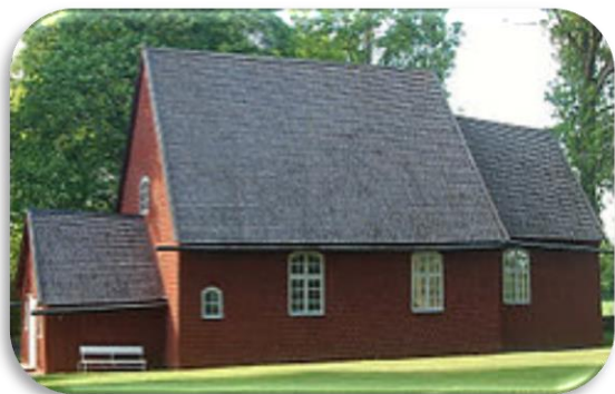
Skagershults gamla kyrka