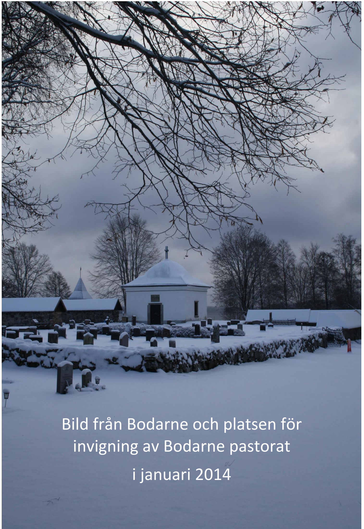
Bild från Bodarne och platsen för invigning av Bodarne pastorat i januari 2014