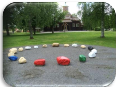
Frälsarkransen i Ramundeboda kyrkpark

Ramundeboda församling har 3 552 invånare och av dessa är 2524 personer medlemmar av Svenska kyrkan. Orten har varit en bruksort, men har mer och mer övergått till att vara en tillverkningsort.