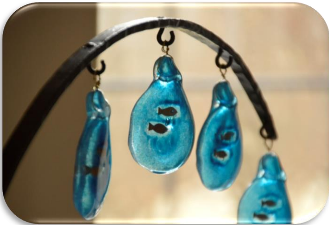
Dopdroppar delas ut till döpta

Kyrkvärdarna samlas vid något tillfälle per år för utbildning och inspiration.