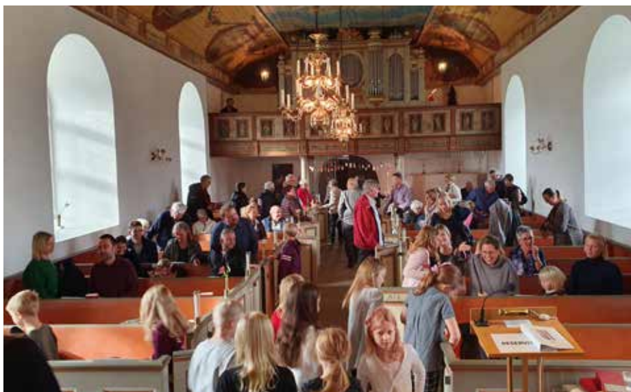
Liv och rörelse vid skördegudstjänsten i Rävinge kyrka.

Tacksägelsedagen var det skördetema på alla våra gudstjänster. Kyrkorna smyckades med olika skördealster som sedan såldes till förmån för Världens Barn. Drygt 9 700 kronor bidrog pastoratets kyrkobesökarna med. Stort tack för ert bidrag!