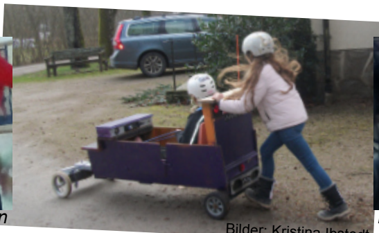
Bilder: Kristina Ibstedt