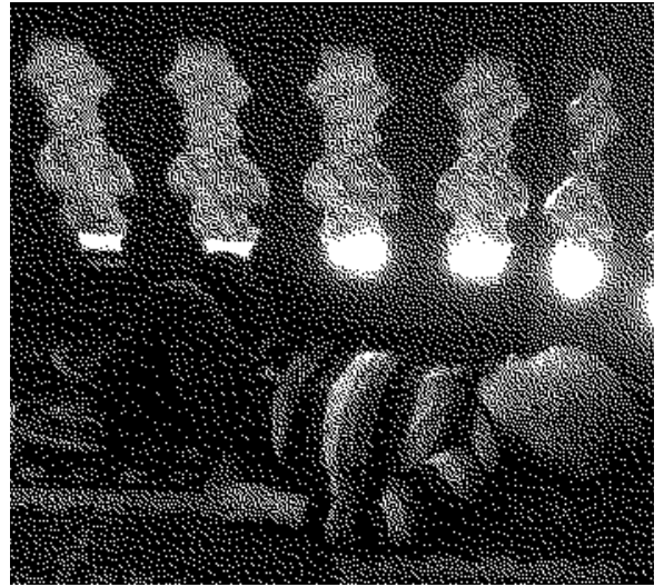
...och en trygg plats att vila på efter hårt arbete.