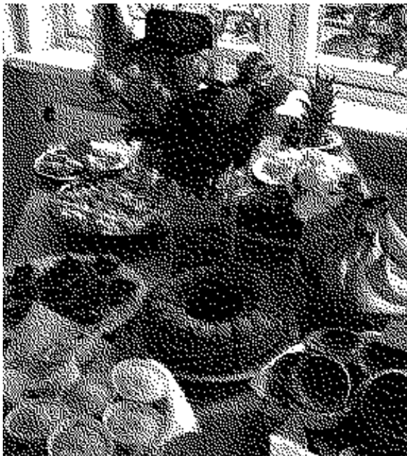
42 st fikade rättvist den 16/10 på den stora fikadagen, Fairtrade challenge.