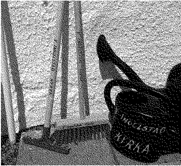
Lite redskap för de minsta kyrkogårdsbesökarna...