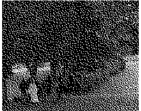
...och efter frukost firades Gudstjänst med små och stora i Vellinge kyrka.