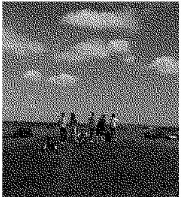
Konfirmanderna i Sommargruppen på Bolmers högar vid Mellan Greve.