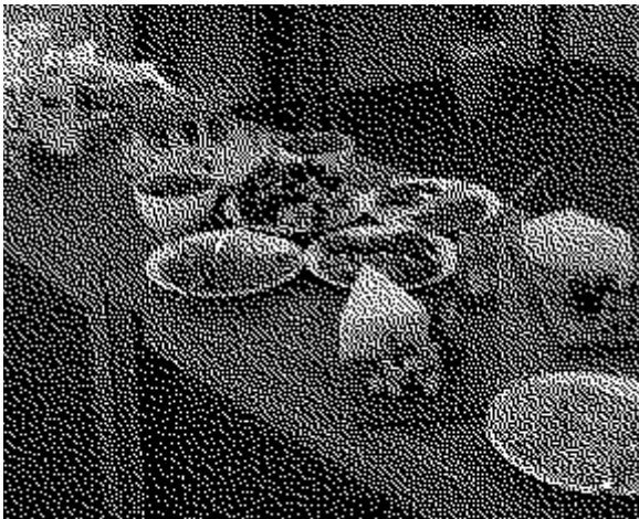
Fyra gånger dukades frukosten upp på Ankarets veranda...