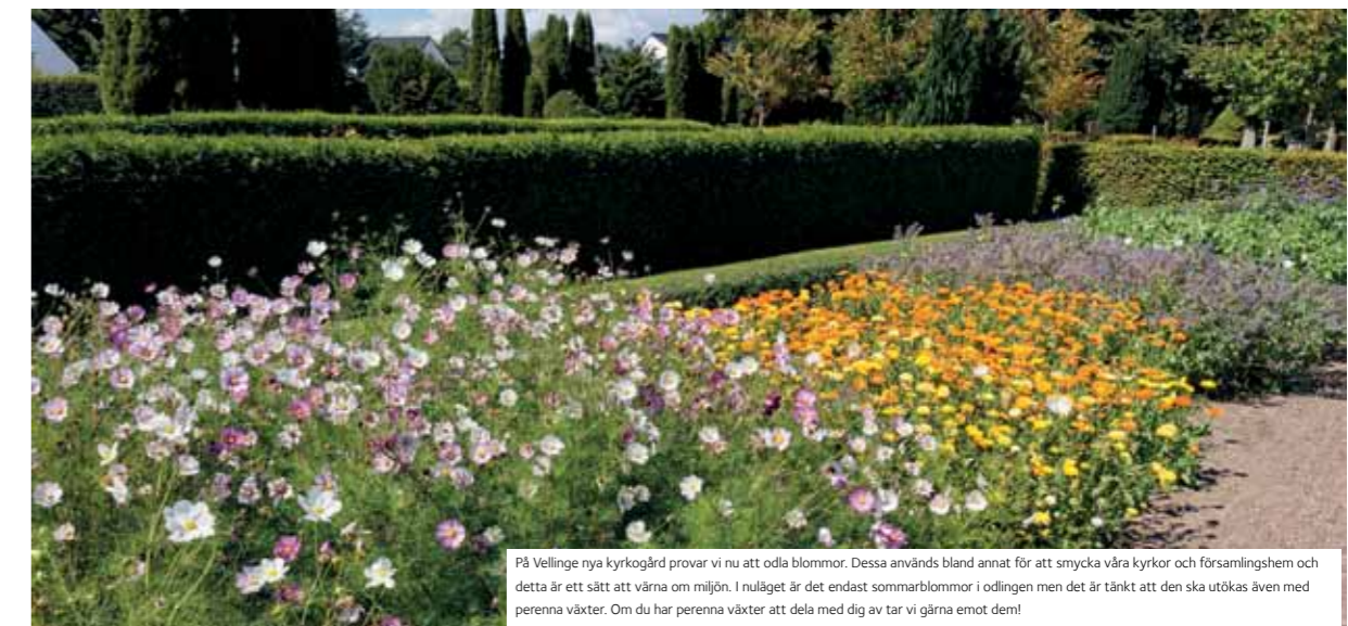
På Vellinge nya kyrkogård provar vi nu att odla blommor. Dessa används bland annat för att smycka våra kyrkor och församlingshem och detta är ett sätt att värna om miljön. I nuläget är det endast sommarblommor i odlingen men det är tänkt att den ska utökas även med perenna växter. Om du har perenna växter att dela med dig av tar vi gärna emot dem!