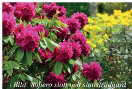
Bild: Sofiero slott och slottssträdgård