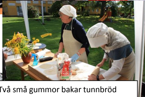
Två små gummor bakar tunnbröd utanför Församlingshuset...