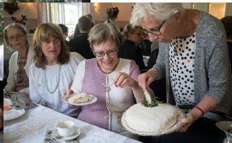
Albertus Pictor-tårtor förstås!