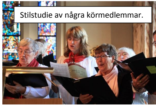
Stilstudie av några körmedlemmar.