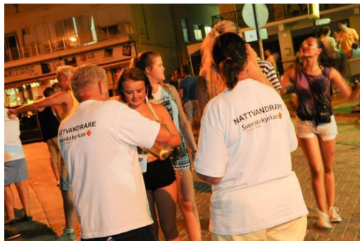
Under sommaren möter Svenska kyrkans nattvandrare på Cypern tusentals svenska ungdomar.

Under 1 oktober till 4 november pågår en särskild insamlingsperiod då bössor finns utställda i våra kyrkor och den 1/10 och 4/11 går rikskollekterna till SKUT. Du kan också lämna en gåva till Svensk kyrkan i utlandets arbete via bg 901-6031 eller pg 90 16 03-1.