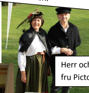
Herr och fru Pictor.

Alla pastoratets körer medverkade och sjöng så vackert, vackert. Här sjunger man tillsammans bönen 'Må din väg gå dig till mötes'