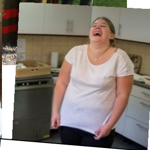
...även ute i köket! 😊

Fullsatt i Församlingshuset och stämningen var på topp!