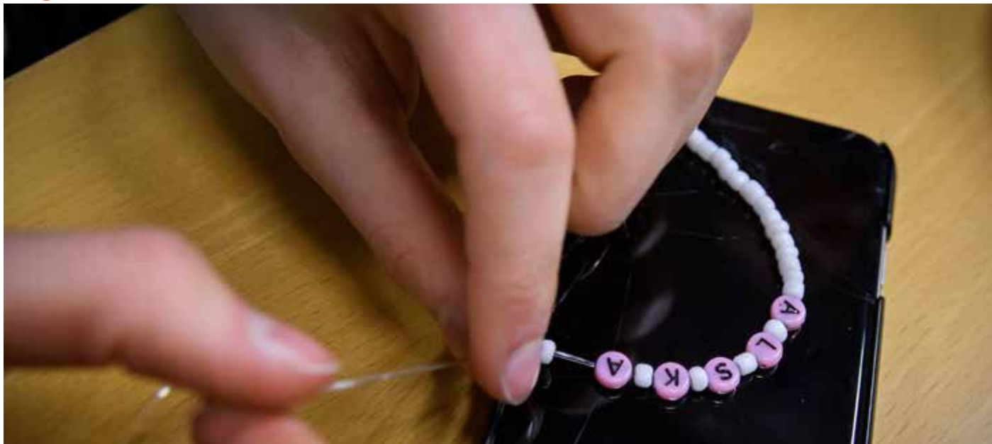
Vi kommer prata, diskutera och fundera över vad livet och tron kan handla om – vem är Gud?