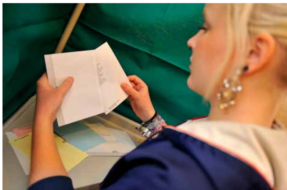
Den som är medlem i Svenska kyrkan, folkbokförd i Sverige och har fyllt 16 år, får rösta i kyrkovalet.