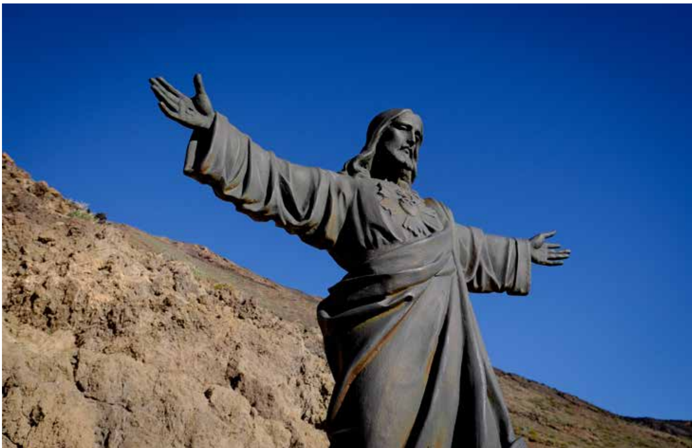
Annandag påsk, den dag som mest märks som en extra ledig dag efter helgen, berättar om hur fler och fler fick möta den uppståndne Jesus.