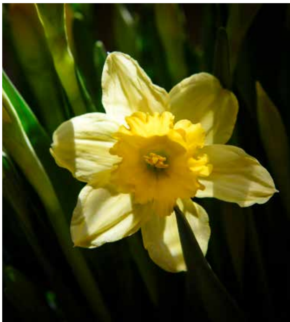
Påskan är kristenhetens största helg, eftersom det är påskhändelserna som är centrum för vår tro.

Annandag påsk, den dag som mest märks som en extra ledig dag efter helgen, berättar om hur fler och fler fick möta den uppståndne Jesus. Uppståndelsen hade många vittnen. Nu börjar man förstå att det som hänt under Jesu liv varit en uppfyllelse av det som Gud lovat sitt folk och hela mänskligheten. Emmaus vandringen berättar om hur två män fick möta Jesus och att dom inte först kände igen honom. Luka-sevangeliets 24 kapitel verserna 13.25 berättar om detta möte. I församlingen firar vi denna gudstjänst på Runmarö, så också i år. Varmt välkomna.