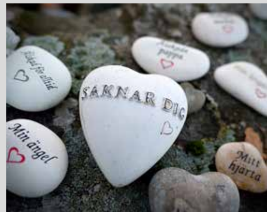
Begravningsavgiften är inte frivillig, utan betalas även av dem som inte är medlem i Svenska kyrkan.

Uppdraget att sköta begravningsverksamheten har Svenska kyrkans församlingar, utom i Stockholm och Tranås där