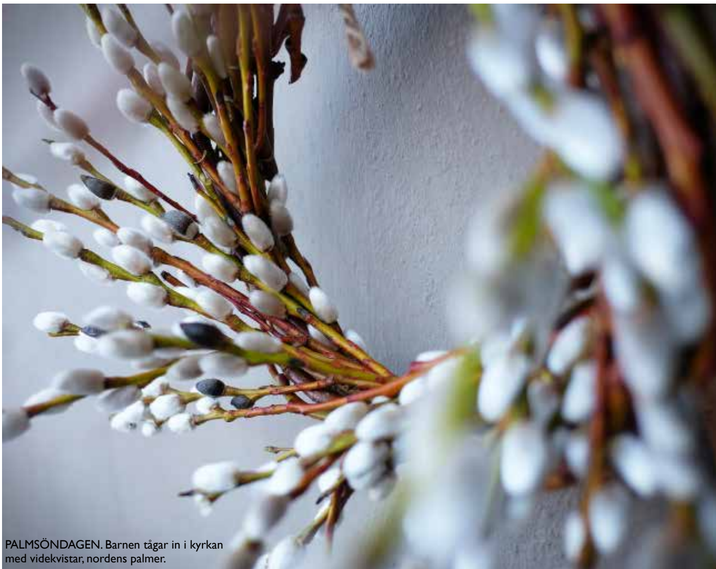
PALMSÖNDAGEN. Barnen tågar in i kyrkan med videkvistar, nordens palmer.

PÅSKDAGEN: "Glad Påsk" önskar vi varandra på påskdagsmorgonen. Påsken är kristenhetens största helg, eftersom det är påskhändelserna som är centrum för vår tro. Genom uppståndelsen förstod lärjungarna att Jesus inte var vilken mirakelgörare som helst utan en alldeles unik person. Ända från första början insåg kyrkan att påsken innebar något alldeles särskilt. Kyrkofäderna, de som lade grunden till det som kom att bli kyrkans lära, kallade helgen för festernas fest. Kring påsken växte sedan det övriga kyrkoåret fram.