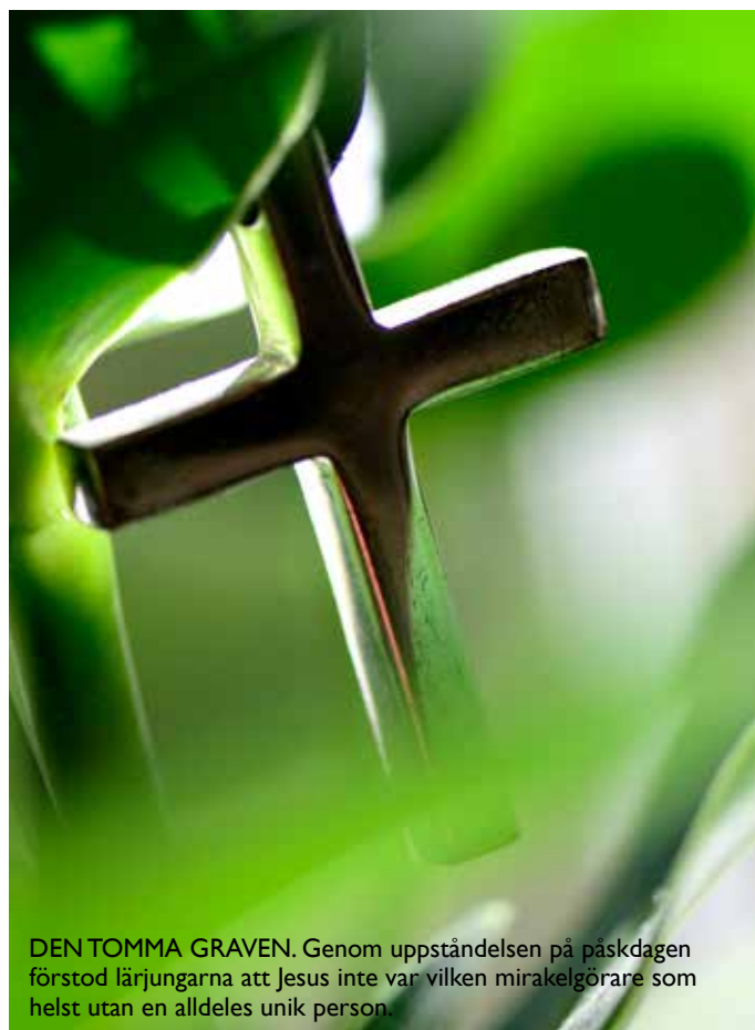
DEN TOMMA GRAVEN. Genom uppståndelsen på påskdagen förstod lärjungarna att Jesus inte var vilken mirakelgörare som helst utan en alldeles unik person.

De bröt genast upp och återvände till Jerusalem, där de fann de elva och alla de andra församlade, och dessa sade: "Herren har verkligen blivit uppväckt och han har visat sig för Simon." Själva berättade de då vad som hade hänt dem på vägen och hur han hade gett sig till känna för dem genom att bryta brödet. Luk 24:33-35