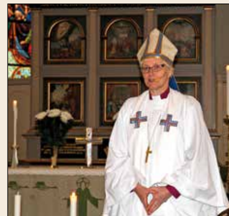
Biskop Antje Jackelén i Lomma kyrka 1 i advent 2012.

Lomma kyrka är en av över 500 kyrkor i stiftet, varav merparten är från medeltiden. Kyrkorna utgör det största sammanhängande kulturarvet i vårt land. Hur vi bäst fyller detta arv med liv även i framtiden påverkar du också genom att rösta i kyrkovalet.