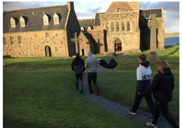
På väg till gudstjänst.