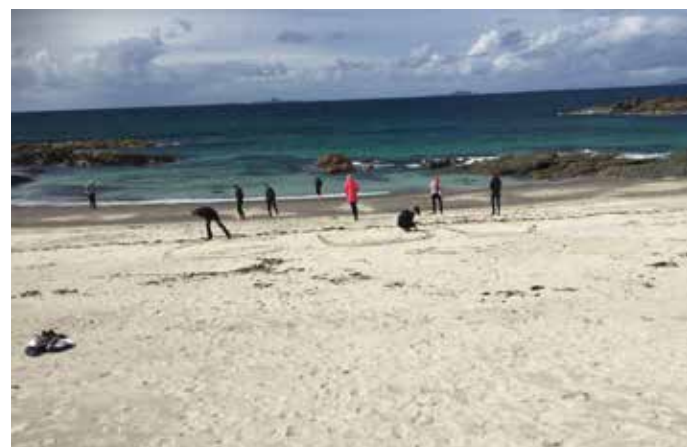
Gud bär dina tankar i sanden.