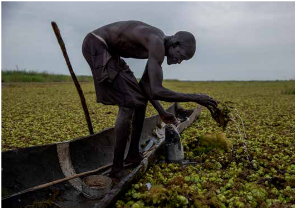
Bilden är tagen i södra Sudan, från en av Niclas Hammarströms reportageresor.

– Jag var på grönan för några veckor sedan med mina ungar och de älskar alla karuseller och bergodalbanor där. Ungarna tvingade mig att åka flera av attraktionerna, och dem kan däremot inte mig skräck, jag var nästan övertygad om