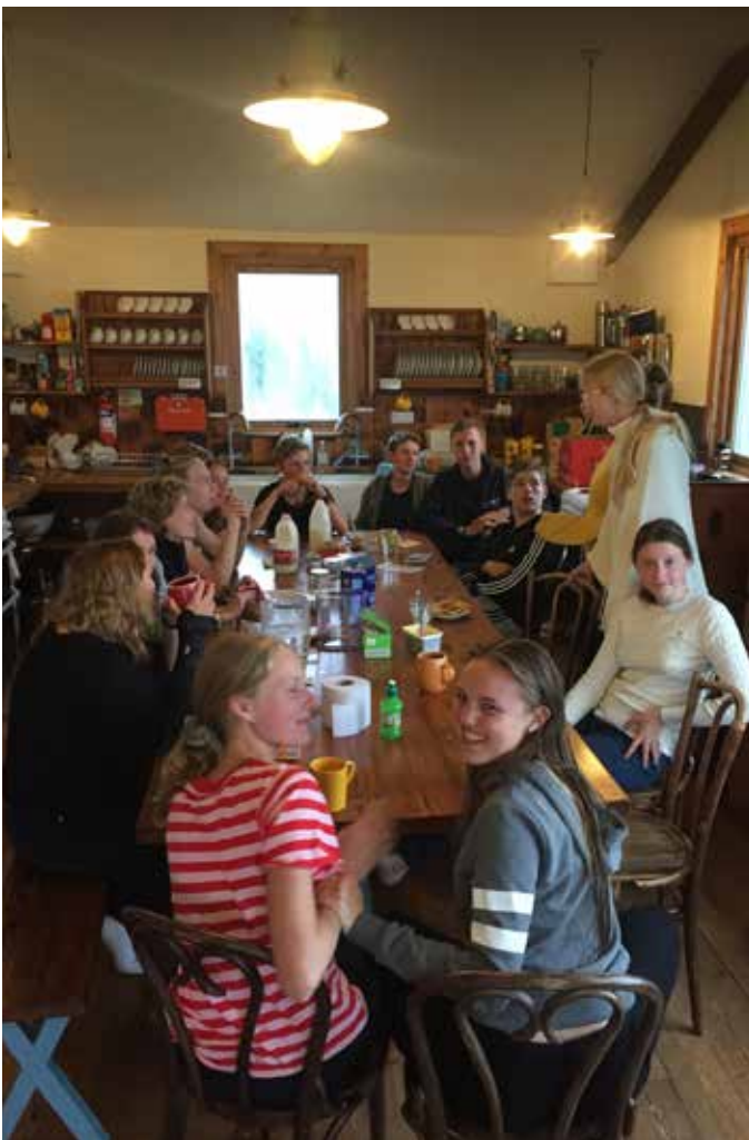
På väg mot toppen.