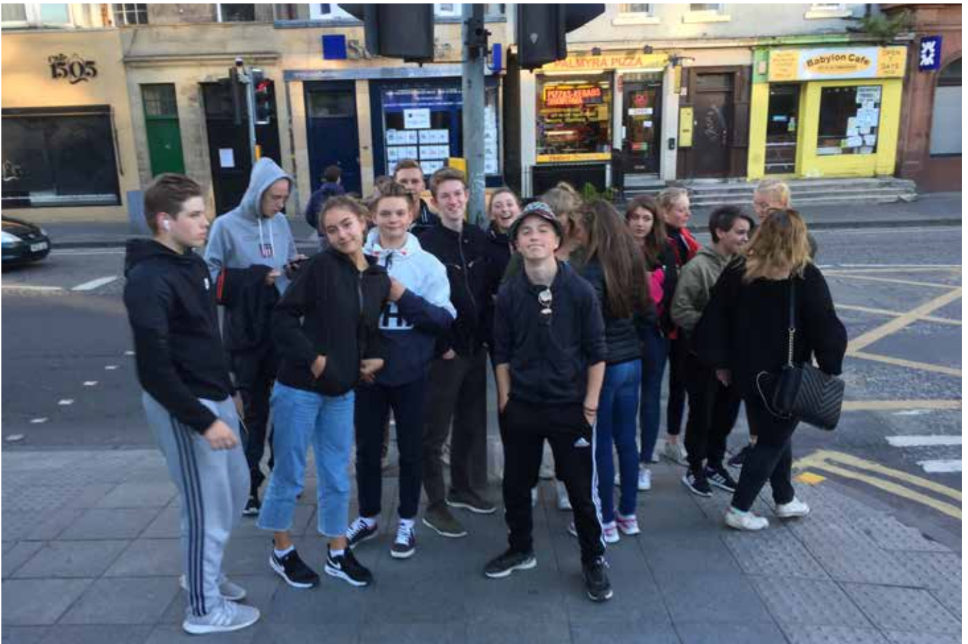
Härlig kväll i Edinburgh.