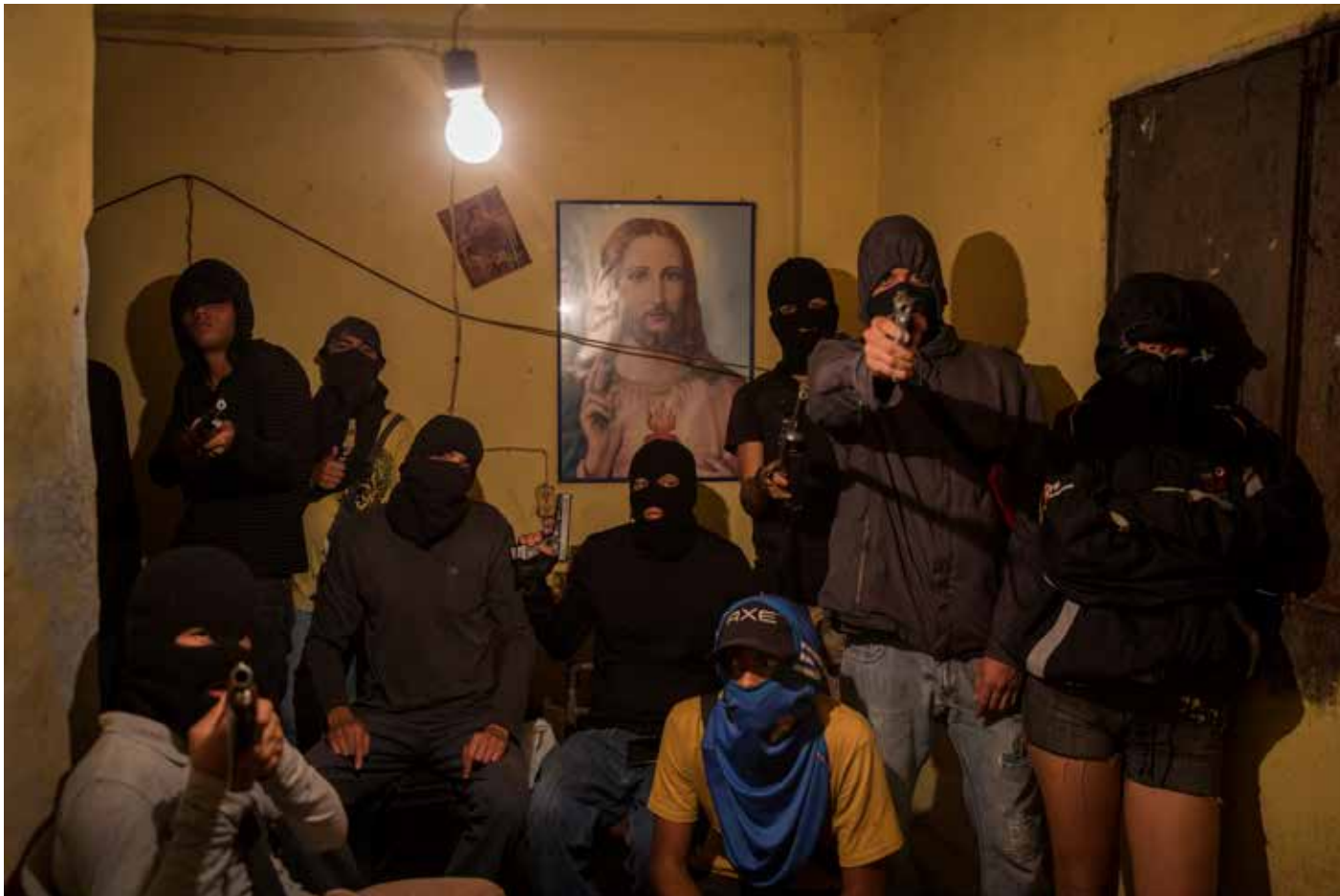
Rebeller i Venezuela. Skarpt läge på en av Niclas Hammarströms reportageresor.