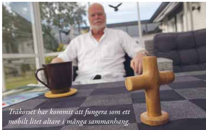
Träkorset har kommit att fungera som ett mobilt litet altare i många sammanhang.

- Ofta har det blivit oerhört fint, just därför. Det är något väldigt vackert i det där trygga igenkännandet. Att få komma samman, be och sjunga några välkända psalmer på sitt eget språk. Det centrala blir så tydligt och nära när det är enkelt och avskalat. Det är kyrka för mig.