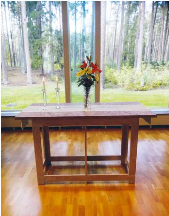
I S:ta Annagårdens kyrksal får naturen vara altartavla. Välkommen in att slå dig ner en stund.

dag. Kanske är det så att du längtar efter att bara komma in i kyrkan en stund en vanlig vardag? Kom! Kyrkan är för det mesta öppen. Sätt dig ner i soffan, läs en tidning, ta en enkel fika, handla rättvisemärkta produkter och böcker. Sätt dig i kyrkan en stund, tänd ett ljus. Kyrkan är allas hem! Därför vill jag uppmana dig: Kom in och känn dig välkommen!