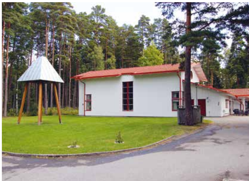
Kyrkklockans klämtande är en gammal kristen tradition. Nu kan klockeringen ljuda över Ardala.

I Sverige är vi vana vid att kyrkan har ett torn där klockorna ringer så det hörs över bygden. Men vad gör man om kyrkan inte har ett torn? Då kan man bygga en klockstapel, och därmed knyta an till en mycket gammal tradition. Medeltidens kyrkor var nämligen i regel tornlösa, och kyrkklockorna hängde ofta i en separat konstruktion.