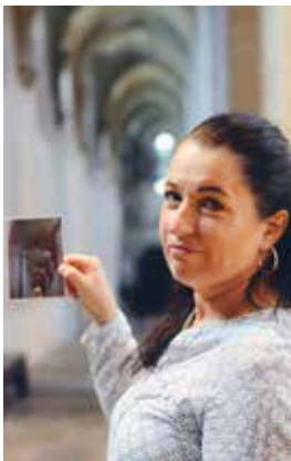
Bilder och symboler används gärna inom kyrkopedagogiken.

- Jag tror att vi behöver det. Vi lever i en stressig värld där allt ska gå fort. Oavsett om vi bekänner oss till en tro eller inte så tror jag att vi har ett behov av att stanna upp.