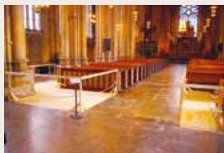
Några inre förändringar i domkyrkan innebär ett nytt pentry och ett ”kyrktorg” längst bak i katedralen.