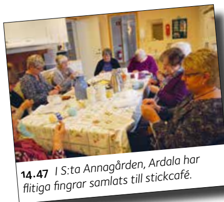
14.47 I S:ta Annagården, Ardala har flitiga fingrar samlats till stickcafé.