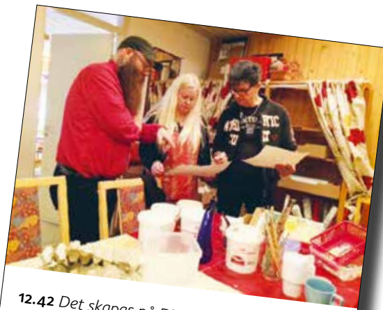
12.42 Det skapas på Diakonihuset Planeten!