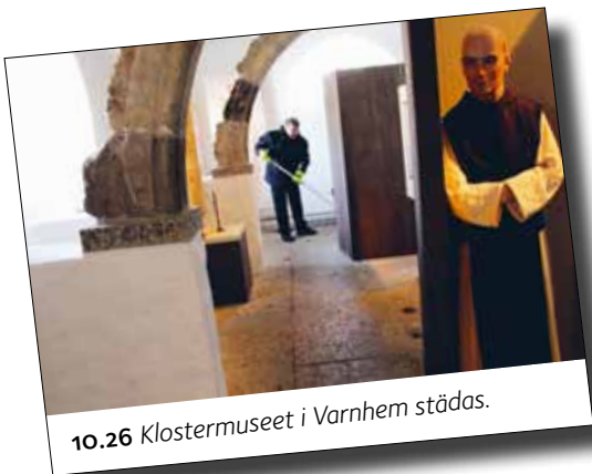
10.26 Klostermuseet i Varnhem städas.