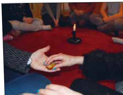
15.45 Dags för en stilla stund hos juniorerna i Ardala.