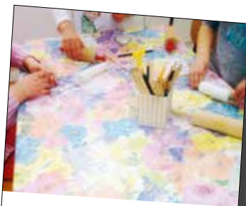
17.12 Pyssel och sång i Valle församling. Den här dagen har barnen börjat tillverka kors. De har också pratat om den stundande påsken och om vad som hände Jesus.