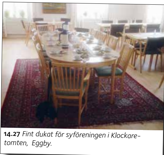
14.27 Fint dukat för syföreningen i Klockare- tomten, Egby.