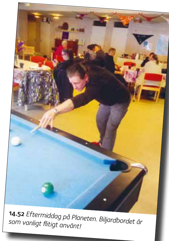
14.52 Eftermiddag på Planeten. Biljardbordet är som vanligt flitigt använt!