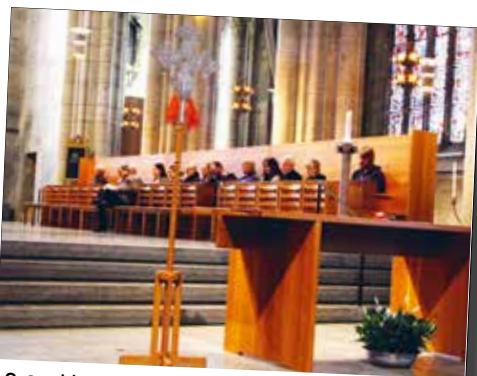
8.03 Morgonmessa i Skara domkyrka. Den inleder varje onsdagsmorgon och är öppen för alla som vill börja dagen med en enkel och stilla nattvardsgudstjänst.