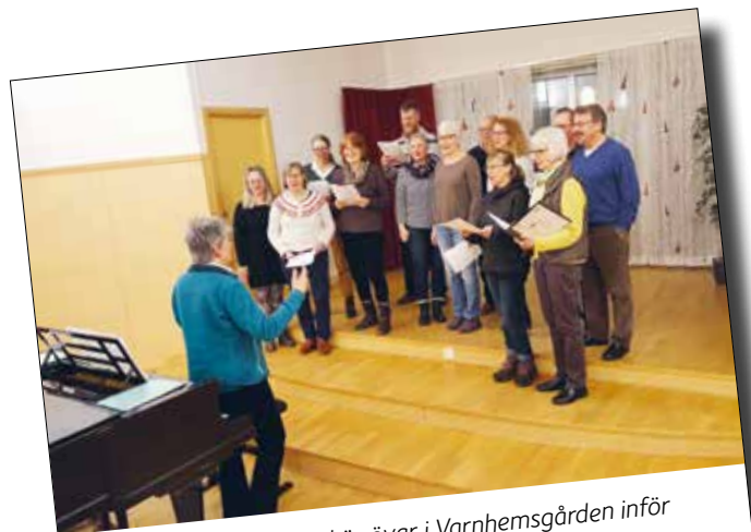
20.27 Varnhems kyrkokör övar i Varnhemsgården inför kommande gudstjänster och konserter.