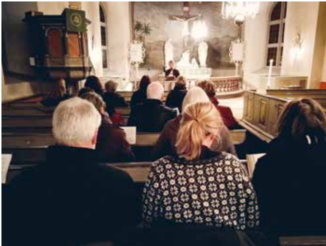
Varje lördagkväll är det helgmålsbön i Bjärklunda kyrka.