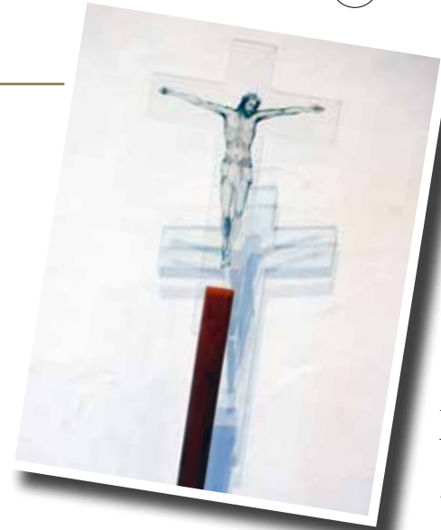
Korset i Marie begravnings- kapell.

Att korset skulle bli den främsta kristna symbolen var på inget sätt självklart. Tvärtom var korset vid Jesu tid förknippat med skändlighet och alls inte positivt eller hoppfullt. Varför då? För det första var korset ett romerskt avrättningsredskap som användes för dem som utöver att avrättas också skulle förnedras. Den som var romersk medborgare slapp denna metod, som istället drabbade kriminella och andra folkgrupper mer frikostigt. För det andra var korsfästelsen enligt judisk tro förknippad med Guds förbannelse. Enligt 5 Mos 21:22-23 var den som avrättades så förbannad: ”Om någon döms till döden för ett brott och avrättas och du hänger upp honom på en påle, får hans lik inte hänga kvar på pålen över natten. Du måste begrava honom sam-