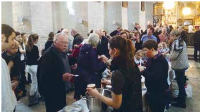
Redan nu firas gemensamma församlingsfester i Valle.

Sedan några år har Varnhems, Eggby-Öglunda och Axvalls församlingar ett gemensamt arbetslag. Så i praktiken har man redan arbetat tillsammans en tid.