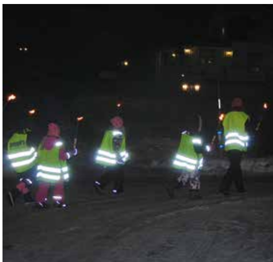
Fackeltåg i Edsberg