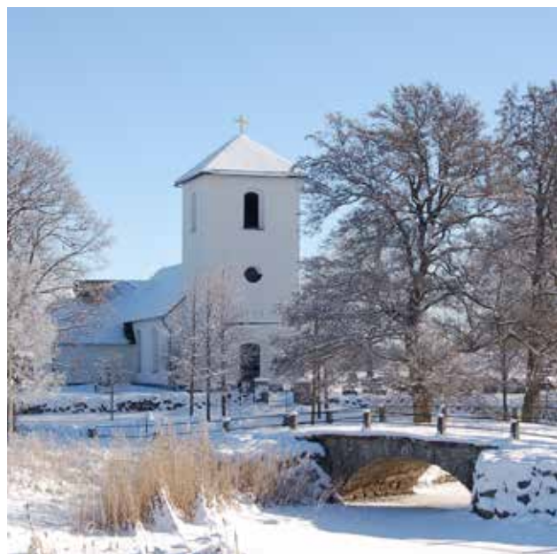
Täby kyrka

Präst, arbetsledare i Edsbergs, och Mosjö-Täby församlingar