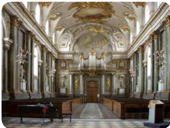
Slottskyrkan ▲ Storkyrkan och Slottsbacken ▼

Vi besöker delar av Kungliga slottet, Slottskyrkan och Storkyrkan.