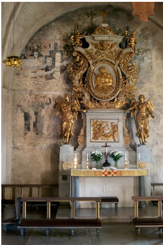
altaruppsatsen och kalkmålningar från 1500-talet.