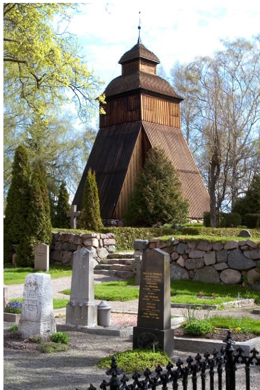
klockstapeln vid Danderyds kyrka.

Kyrkogårdens första utvidgning söder om gamla muren utfördes 1916 efter ritningar av Lars Israel Wahlman, en av dåtidens stora arkitekter. Redan 1922 utvidgades kyrkogården ytterligare och ett gravkapell uppfördes, även det efter ritningar av Wahlman. Intill kapellet byggdes ett bisättnings- och blomsterrum 1976 efter ritningar av arkitekten Uno Söderberg. Strax öster om kyrkan står klockstapeln på en naturlig bergshöjd i landskapet med björkar, stigar och utplacerade stenbänkar. Klockstapeln är upp-