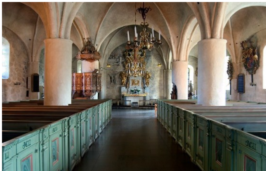
kyrkorummet åt öster.

Kyrkorummets nuvarande form härrör från tidigt 1600-tal, då kyrkan utvidgades åt väst och ändrades till en treskeppig kyrka med fyra travéer . Kryssvalven är från samma tid och bärs upp av kraftiga pelare. Väggar och valv är vitkalkade med undantag för korets och norra långhusväggs fragment av 1530-talets kalkmålningar, framtagna vid 1915-års restaurering.