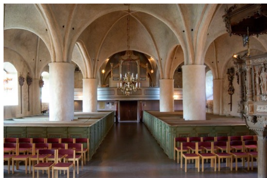
kyrkorummet åt väster.

två förgyllda änglar. Bildhuggaren Rohsenberg var inflyttad från Tyskland och medarbetare till tidens ledande barockkonstnär Burchardt Precht. En likadan altaruppsats finns enligt uppgift i Frösö kyrka i Jämtland. 1979–80 tillkom det nuvarande altaret med tillhörande altarring efter ritningar av arkitekten Uno Söderberg.