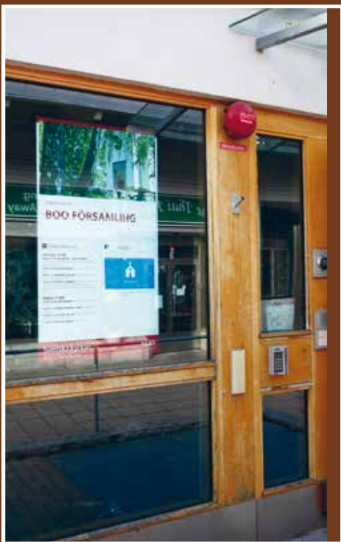
Mer kommunikation framöver! Digitala skärmar är en del i den förändring som församlingen arbetar med.