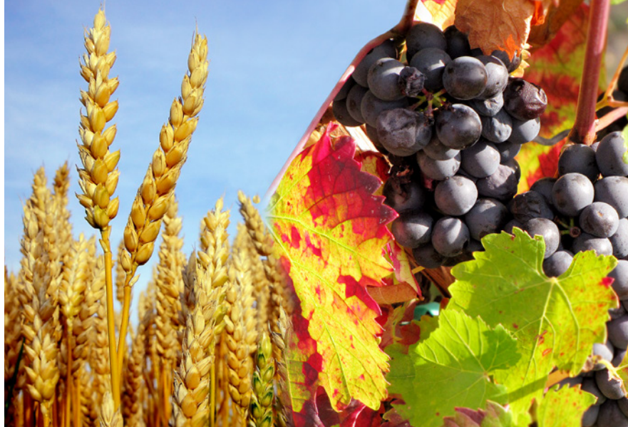
Peltojen viljasta ja vuorenrinteiden rypäleistä..

Kun he söivät otti hän leivän, luki kiitosrukouksen, mursi sen ja antoi sen heille ja sanoi: Ottakaa, tämä on minun ruumiini. ”Ja hän otti maljan, kiitti Jumalaa ja antoi sen heille, ja he kaikki joivat siitä. Hän sanoi:” Tämä on minun vereni, liiton veri joka vuodatetaan monien edestä. (Mark 14:22-24).