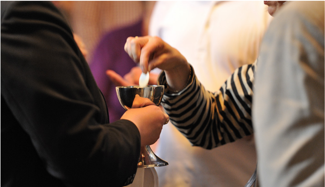
Valokuva: Magnus Aronson/Ikon

Kolmas ulottuvuus on oikeudenmukaisuus. Ehtoollisvirressä 398 lauletaan ”Kun nostamme leivän, näytämme merkin, että oikeus voittaa”. Kun jätämme itsemme Jumalan käyttöön, lähetetään meidät maailmaan jakamaan leipää. Ehtoollisen vietossa meitä muistutetaan siitä, että meidän täytyy toimia sen puolesta, että maailman voimavarat jaetaan oikeudenmukaisesti. Tänäpäin on 20:ellä prosentilla maailman ihmisistä käytössään 80 prosenttia maailman voimavaroista.