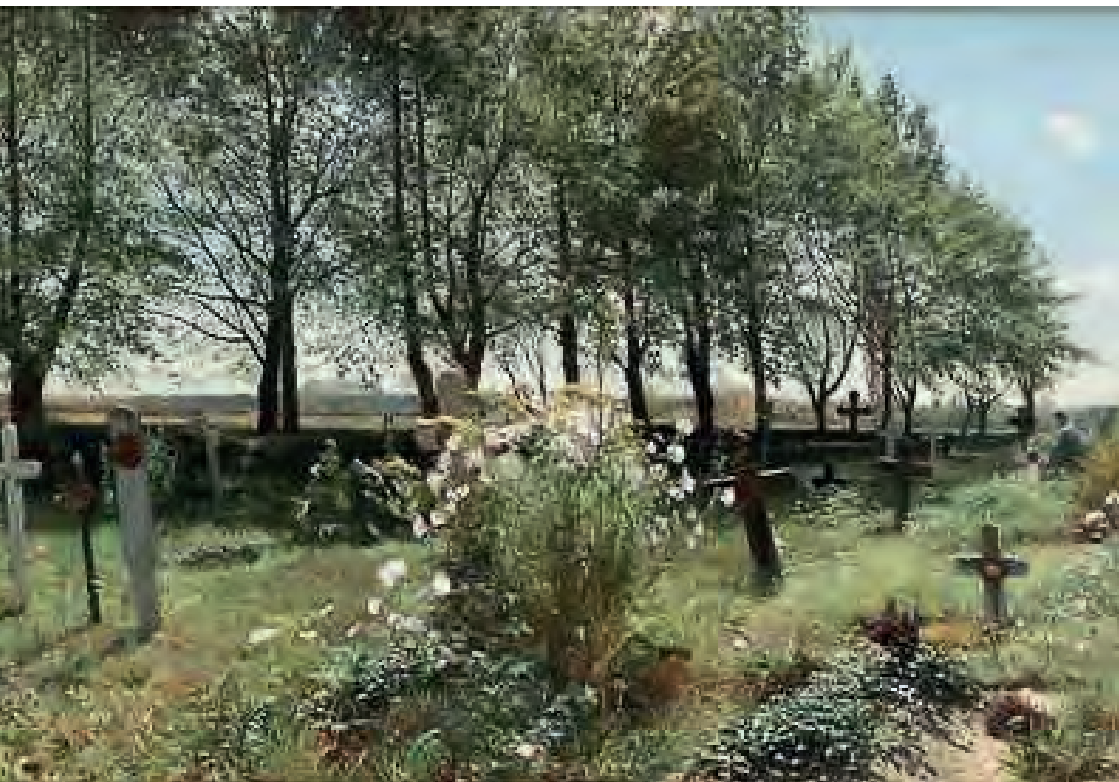
Kyrkogård i sommarsol. En målning av Gottfrid Kallstenius från 1887. Bilden visar en landsortskyrkogård innan gravstenar blev allmänt förekommande och kyrkogården fortfarande var gräsbevuxen. Här finns många perenner och en antydning till trädkrans. Bilden är något beskuren.