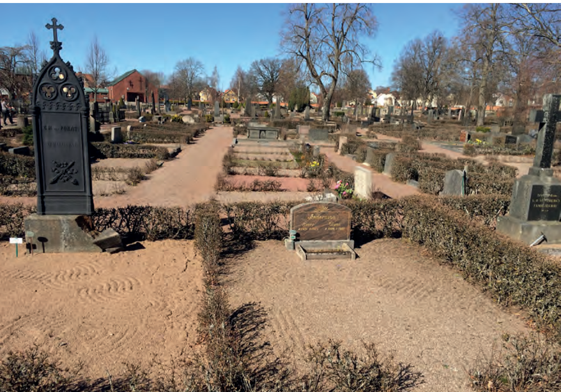
Ett helt kvarter med grusgravar i Eksjö. Modet med krattade gravar uppstod kring förra sekelskiftet. Till vänster i bild ett högrest gjutjärnsmonument.

investera i en påkostad gravanordning med gravstenen i fokus. Nyttjanderätten till en gravplats gick i arv, ett system som upphörde så sent som 1991.