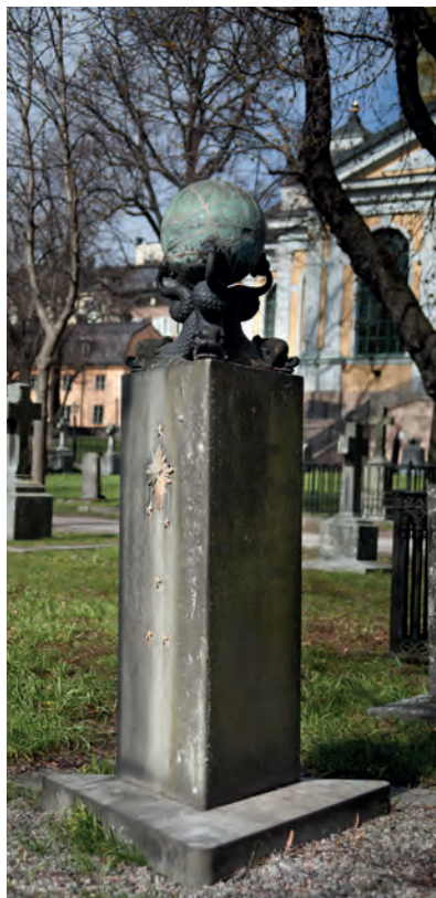
På Katarina kyrkogård i Stockholm finns detta ståtliga gravmonument i sten och metall.