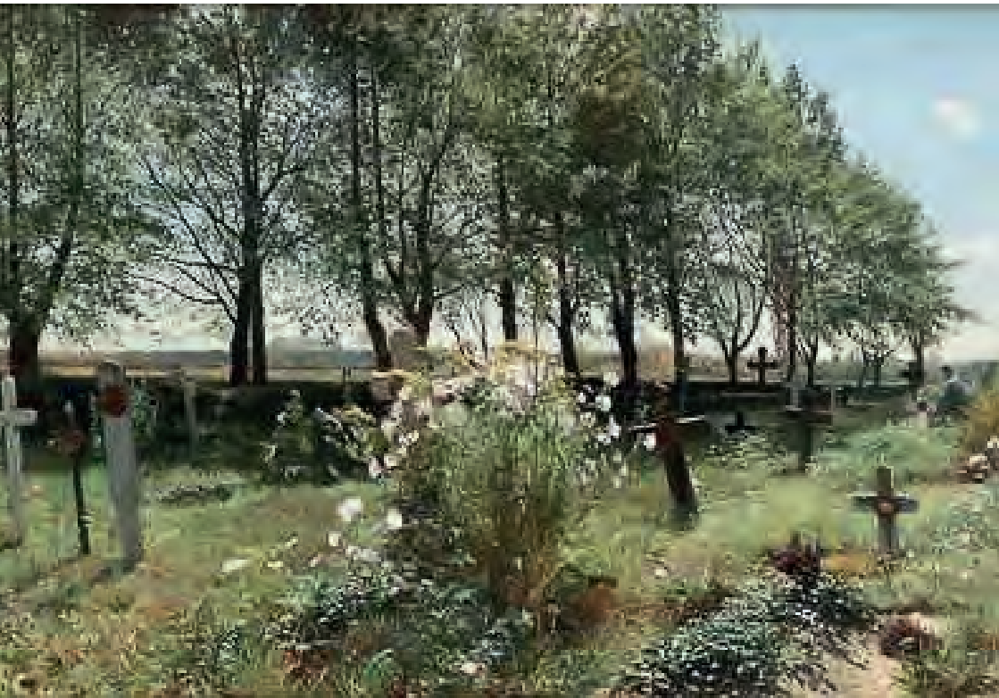
Kyrkogård i sommarsol. En målning av Gottfrid Kallstenius från 1887. Bilden visar en landsortskyrkogård innan gravstenar blev allmänt förekommande och kyrkogården fortfarande var gräsbevuxen. Här finns många perenner och en antydning till trädkrans. Bilden är något beskuren.