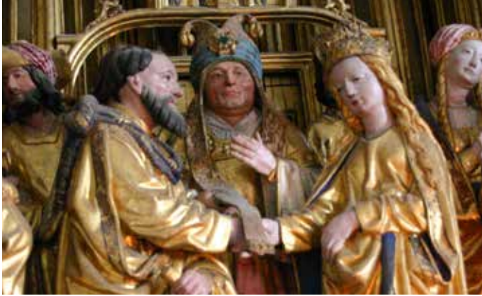
Josef och Maria gifter sig. Scen ur altarskåpet i Skepptuna kyrka.