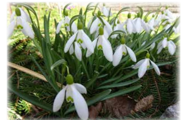
Med reservation för ev. ändringar.

Otterbäckens Kyrka kl.11 Mässa. Sjötorps Kyrka kl.19 Musikgudstjänst. "Musik i sommarkväll".