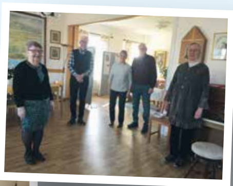
Världsböndagen frades i Kyrkans hus och i Breviks församlingshem med utställning och andakt.