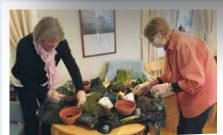
Många påskhälsningar delades ut i pastoratet.