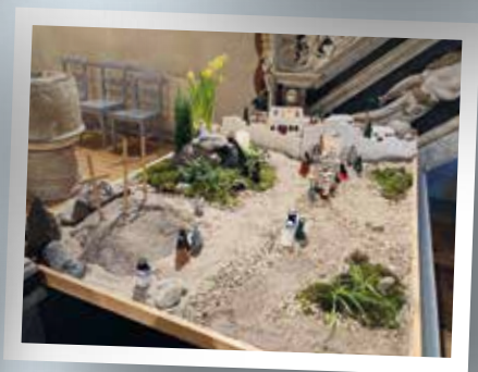
Påsklandskap i Mölltorps kyrka.