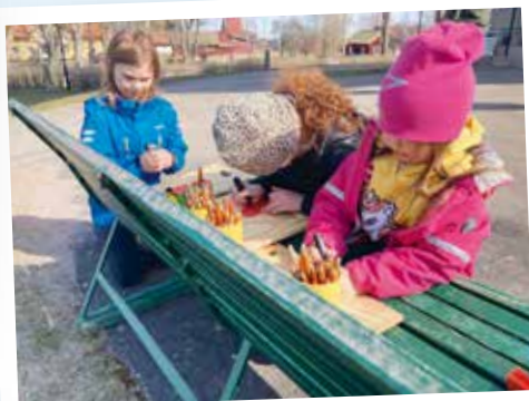
Familjevandring i Udenäs.

Under våren har vi bjudit in till familjevandringar vid tre tillfällen runt om i pastoratet. Detta för att få träffa barnen i våra grupper och få dela ut dophjärtan till de barn som döptes 2020. Vid varje tillfälle fick barn och föräldrar gå en runda med fem stationer med aktiviteter för olika åldrar. Vid sista stationen bjöds på gott fika. Vandringarna har varit mycket uppskattade.