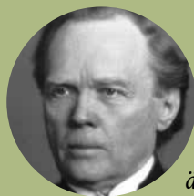
Nathan Söderblom (1866-1931), svensk teolog och Svenska kyrkans ärkebiskop 1914–1931. Han var en av de

2011 Regeringsformen omarbetas, vilket bland annat innebär ett stärkt skydd mot diskriminering på grund av sexuell läggning och integritetsintrång.