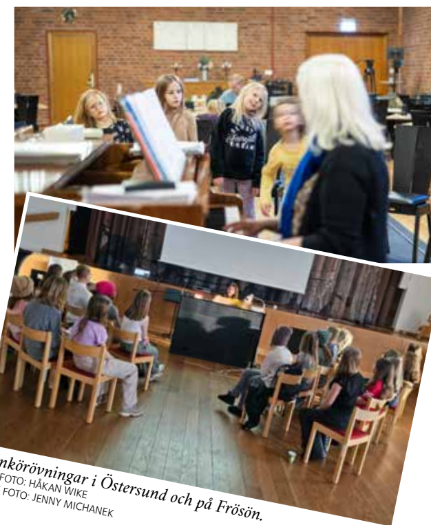
Barnkörövningar i Östersund och på Frösön. ÖVRE FOTO: HÅKAN WIKÉ NEDRE FOTO: JENNY MICHANEK