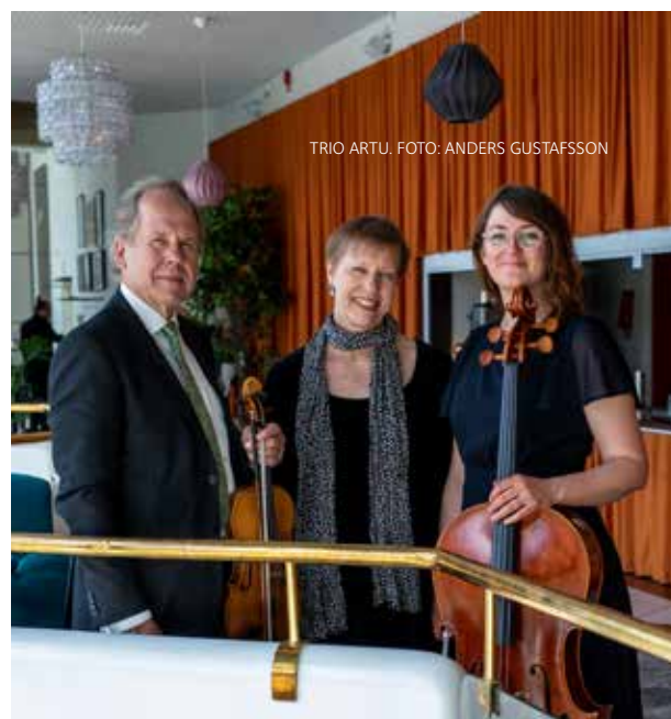
TRIO ARTU.

Varje 11:15 tisdag & torsdag LUNCHBÖN 15 minuter innan lunchserveringen stillar vi oss en stund i kyrkan.