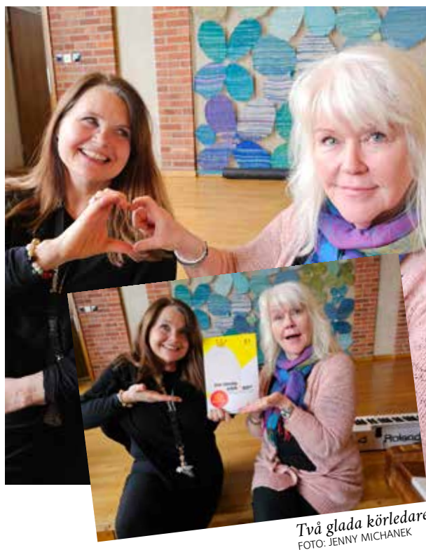
Två glada körledare.

HUR KOM DET SIG ATT DET BLEV DEN HÄR MUSIKALEN SOM NI GÖR MED BARNKÖRERNA?