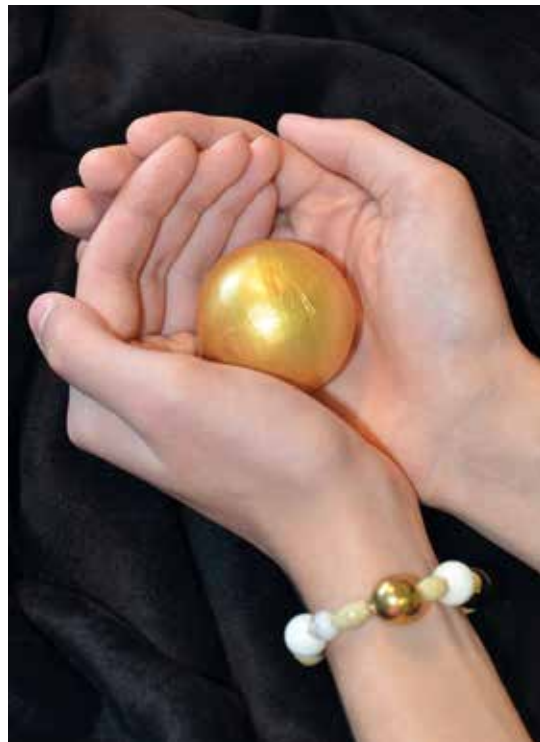
Gudspärlan i frälsarkransen. Symboliserar Gud.