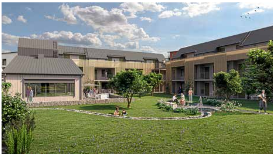
Generationsboendet i Almby kyrkpark kommer att ha flera platser för gemenskap.

➤ MER INFO och intresseanmälan: svenskakyrkan.se/orebro/bo