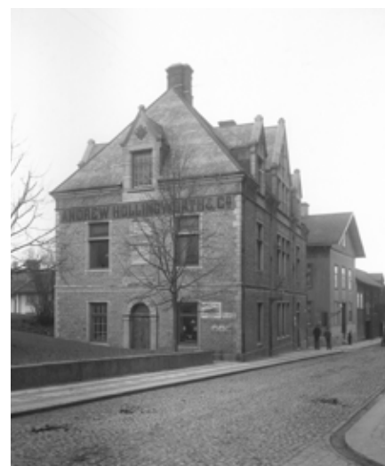
Nikolai församlingshem år 1903 (då maskinfirma).

Huset är klassat som statligt kulturminne och genomgår för närvarande