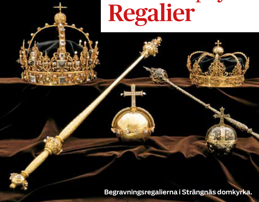
Begravningsregalierna i Strängnäs domkyrka.

DET VAR SOMMAREN 2018. Inne i Strängnäs domkyrka slår tjuvar med slägga sönder skyddsmontern med begravningsjuvelerna efter Kung Karl IX och Drottning Kristina d.ä. Som stöldbyte får de med sig två guldkronor och ett riksäpple innan de flyr från kyrkan på cykel och sedan i motorbåt.