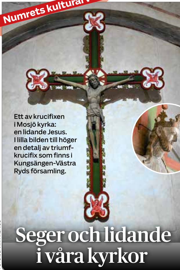
Ett av krucifixen i Mosjö kyrka: en lidande Jesus. I lilla bilden till höger en detalj av triumfkrucifix som finns i Kungsängen-Västra Ryds församling.