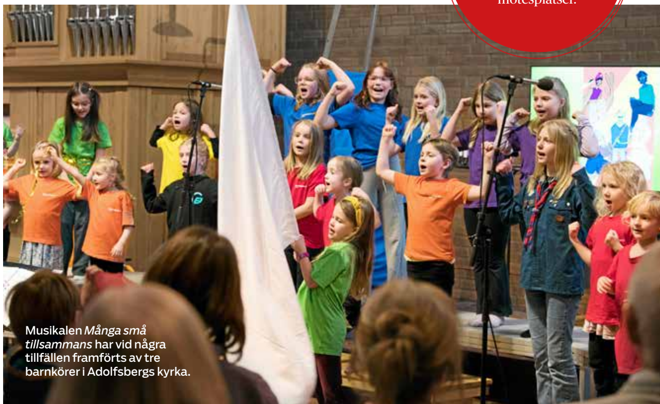
Musikalen Många små tillsammans har vid några tillfällen framförts av tre barnkörer i Adolfsbergs kyrka.

Du bidrar till att barn och deras vuxna får tillgång till viktiga mötesplatser.