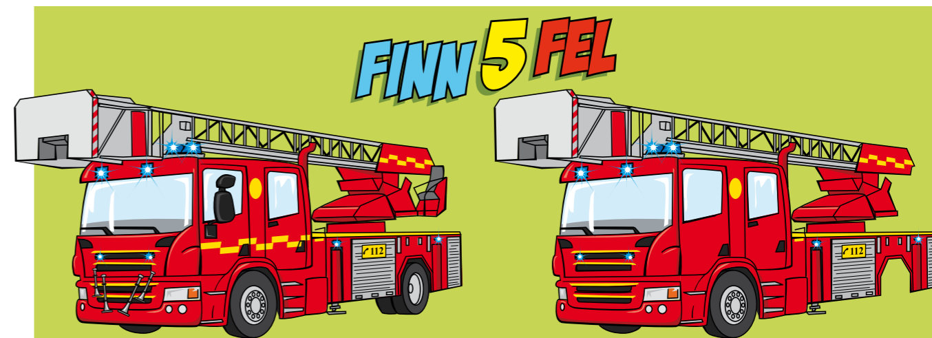
Fach: Signalhornen, gula markeringen på hylen, backspjelen, stegstolen, bakljuset