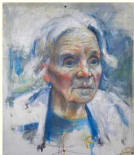
TRAUTE LAFRENZ PAGE DEN HVITE ROSE

Vi fick lära oss om vi och dem och vad som riskerar att hända om man ställer grupper mot varandra istället för att älska vår nästa som Jesus lärt oss. Vi fick lära oss vikten av att säga ifrån, att inte tillhöra den tysta massan och blunda för onskan.