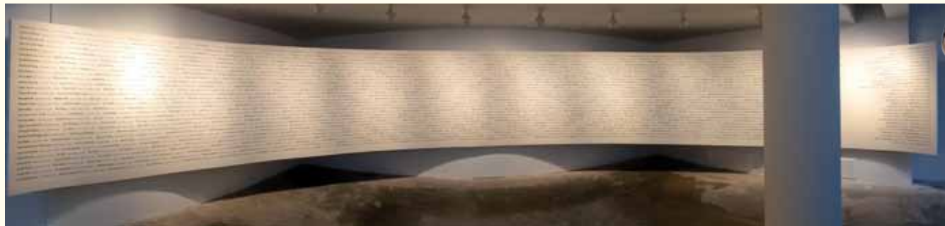
Minnestavla på Holocaust sentret med namn på mördade judar och romer. Exakt antal går inte att fastställa då hela familjer kan ha utplånats.

För andra året i rad tog vi våra konfirmander med på en Hågkomstresa till vårt grannland Norge. Och vad har då Norge att berätta om, som vi ska komma ihåg? Jo, erfarenheten av att hastigt över en natt kastas från demokrati till diktatur och allt vad det innebar. Alldeles på andra sidan gränsen, bara några mil härifrån, pågick faktiskt förintelsen av de norska judarna och romerna.