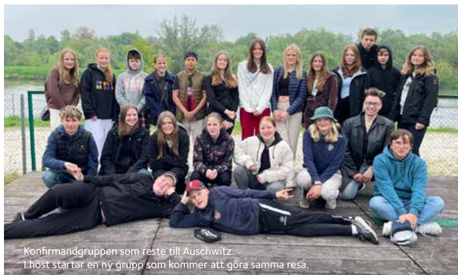
Konfirmandgruppen som reste till Auschwitz. I höst startar en ny grupp som kommer att göra samma resa.