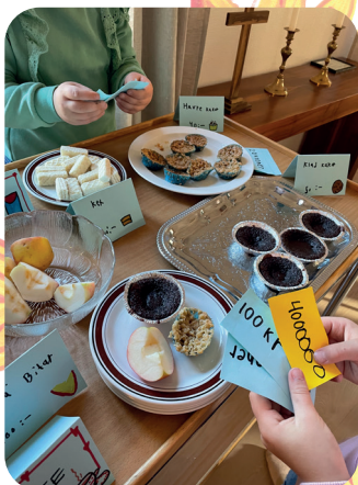
Café på gott & blandat! Smakar det så kostar det!

Här får ni en liten återblick från hösten 2022!