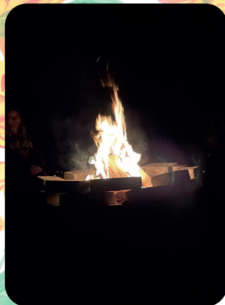
Lägereld vid ungdomarnas hajk vid vindskyddet i Linderöd.