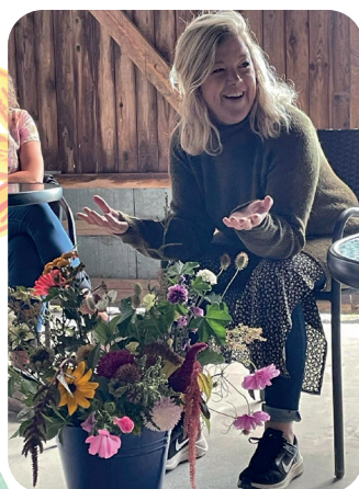
Kreativ Afton på Skogsliden.