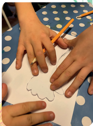
Höstlovsskoj med fredspysSEL.