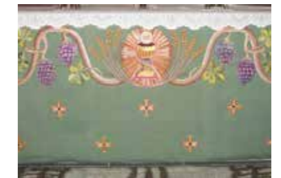
Antependie i Västra Tunhems kyrka