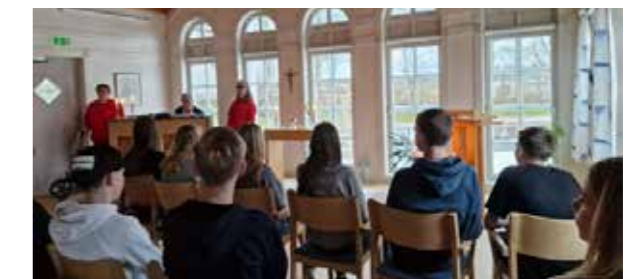
Konfirmander är med på sinnesromässa i Väne Åsaka församlingshem.