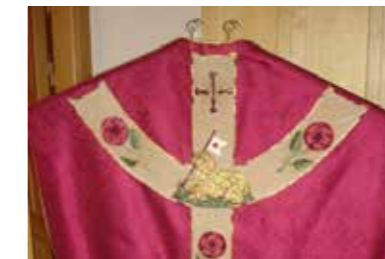
Mässshake i Gärdhems kyrka