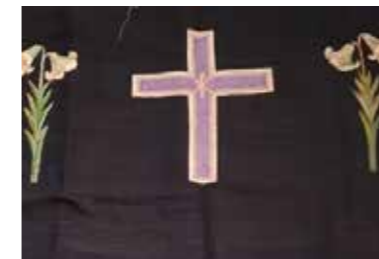
Nyfunnet antependie i Vänersnäs kyrka