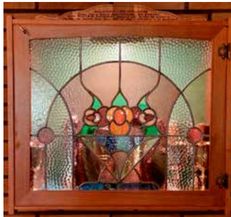
Skåp för nattvardskärl med dörr av medeltida glas