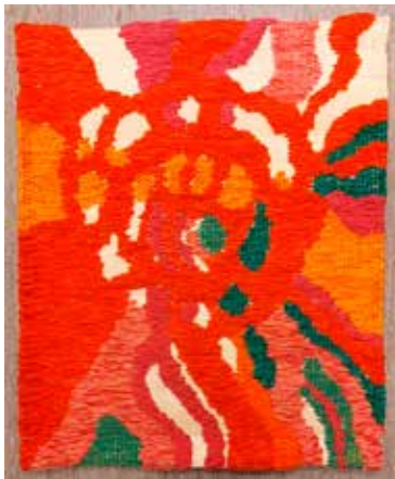
"Solglöd" av Ulrika Lönnå

Söndag 4 februari, Kyndelmässodagen, planerar vi för en särskild visningsgudstjänst då vi kommer att visa och berätta om de förändringar som gjorts.