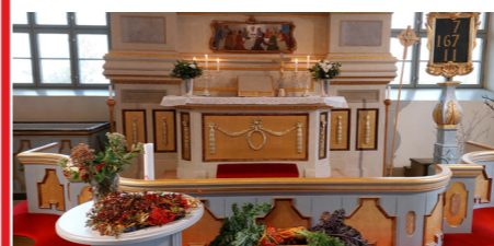
Skördegudstjänst i Attmars kyrka.