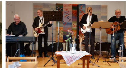
Dagträffarna har kommit igång igen efter pandemin. Värddar för träffarna är Internationella gruppen. På bilden ser vi Gentlemen som underhöll på den första dagträffen i Tuna församlingshem den 20 oktober. Nästa Dagträff blir i Attmars församlingsgård onsdag 24 november kl. 11.00.