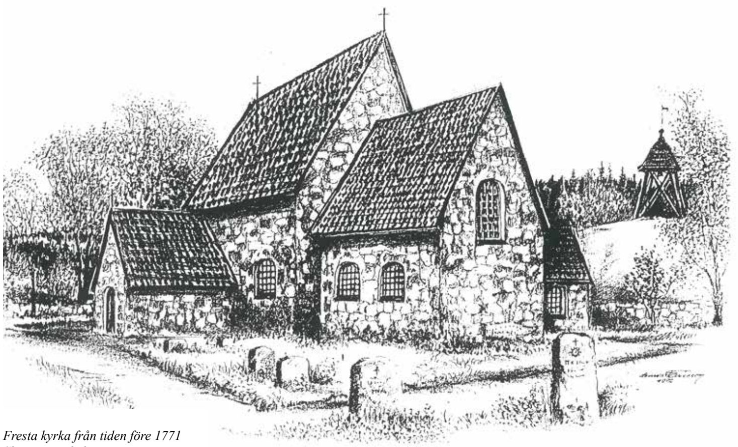
Fresta kyrka från tiden före 1771 Skiss av Väsbykonstnären Lennart Ericson.

sina kolonistugor och sommarvistelser. Till den bofasta befolkningen hörde många trädgårdsmästare som i åtskilliga växthus i Fresta odlade olika slags grödor och blommor som såldes i torghandeln inne i huvudstaden. 1920 fanns det 699 invånare i Fresta När församlingens på 70-talet bebyggdes av allt fler villor och radhus i takt med Stor-Stockholms utvidgning växte folkmängden avsevärt. I det skedet växte också behoven och kraven på kyrklig service och verksamhet. Som en följd av denna utveckling blev, som tidigare nämnts, sålunda Fresta eget självständigt pastorat 1982. Samma år invigdes Bollstanäs församlingshem som du kunde läsa om i förra numret av Församlingsbladet.