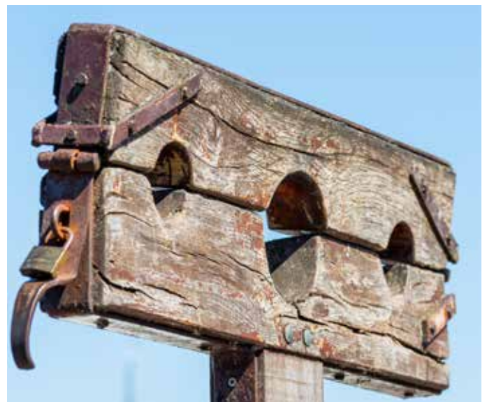
Stupstocken var ett offentligt skamstraff. Begreppet lever kvar i domstolarna men avser idag något helt annat.

Också i evangelierna finns flera bilder av domen. Det presenteras en realiserad eskatologi, det vill säga att domen är närvarande i realltid; domen finns i våra liv här och nu och inte senare som en hopräkning av goda och dåliga handlingar vid livets eller tidens slut. Denna syn på domen presenteras i Johannesevangeliet, medan de synoptiska evangelierna, det vill säga Markus, Matteus och Lukas, sna-