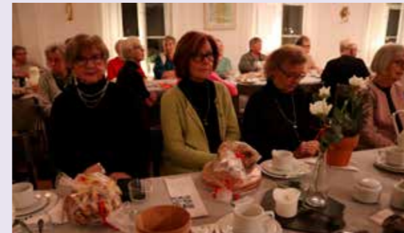
Välbesökt syföreningsauktion, där behållningen blev 22 287.