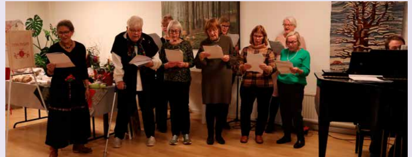
Kaffekörens första uppsjungning i samband med syföreningens auktion.

Årets resultat till Act-Svenska Kyrkans julinsamling i Lyrestads församling blev 7 543 kr och i Amnehärads församling 28 793 kr. Ett stort TACK säger vi till alla givare.