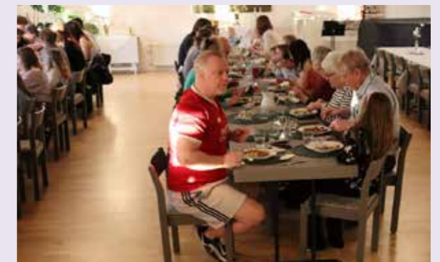
Efter Familjegudstjänsten blev det tacofest i församlingshemmet.