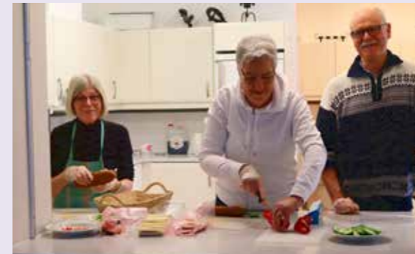
Full fart i köket inför lunchmusiken.