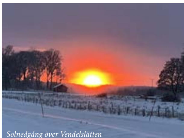
Solnedgång över Vendelslätten

Det behövs alltid en hjälpan- de hand. Med kaffekokning, göra smörgåsar, besöka ensamma, följa med på en promenad. Det finns alla möjliga behov att fylla och om du vill göra en insats tas det tacksamt emot!