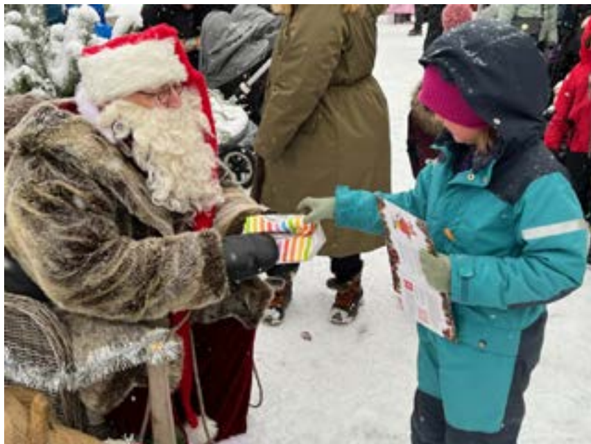
Tomten delade ut godispåsar och flera provade på ponnyridningen på Örbyhus julmarknad andra advent.