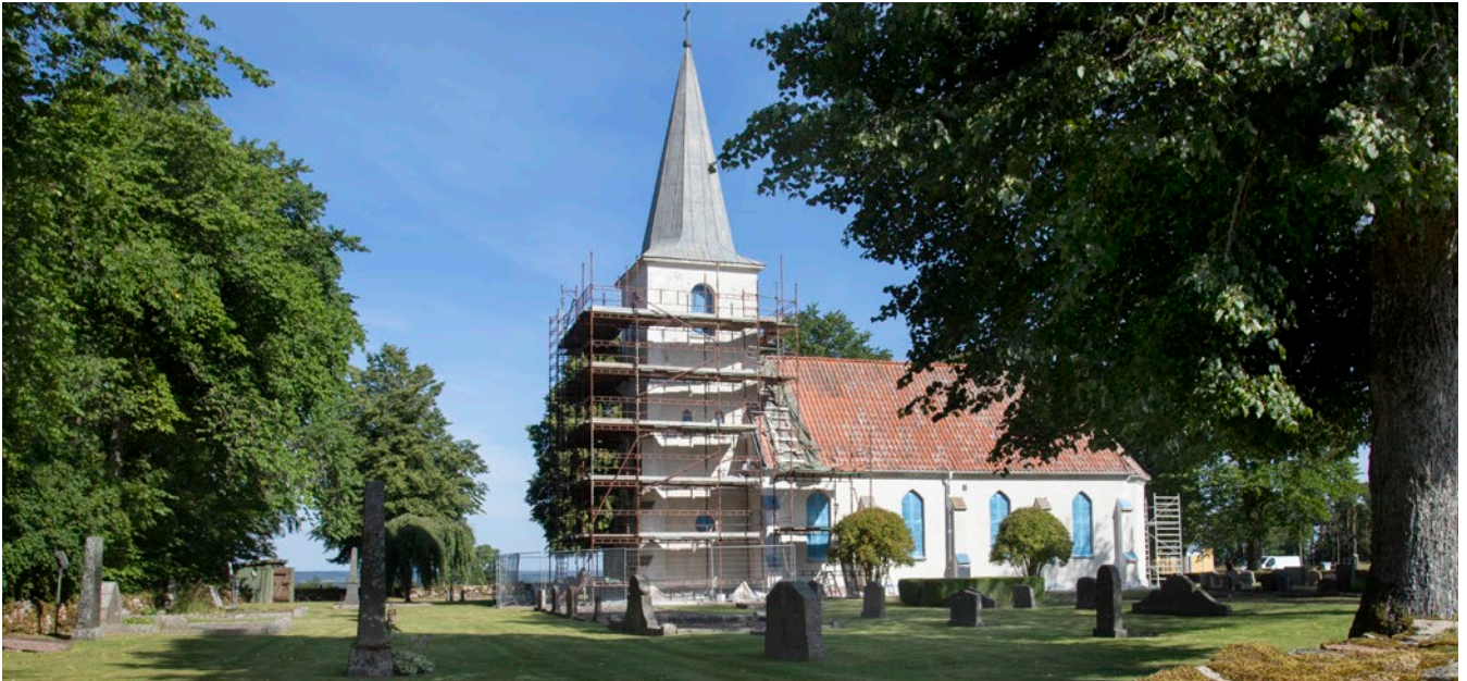
På Östra Tunhems kyrka renoveras fasad, fönster och trappor.