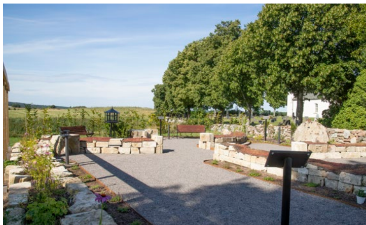
Nya begravningslundan i Gudhem har väckt stort intresse

Det finns mer information på pastoratets hemsida om kyrkogårdarna och olika typer av gravsättning. www.svenskakyrkan.se/stenstorp