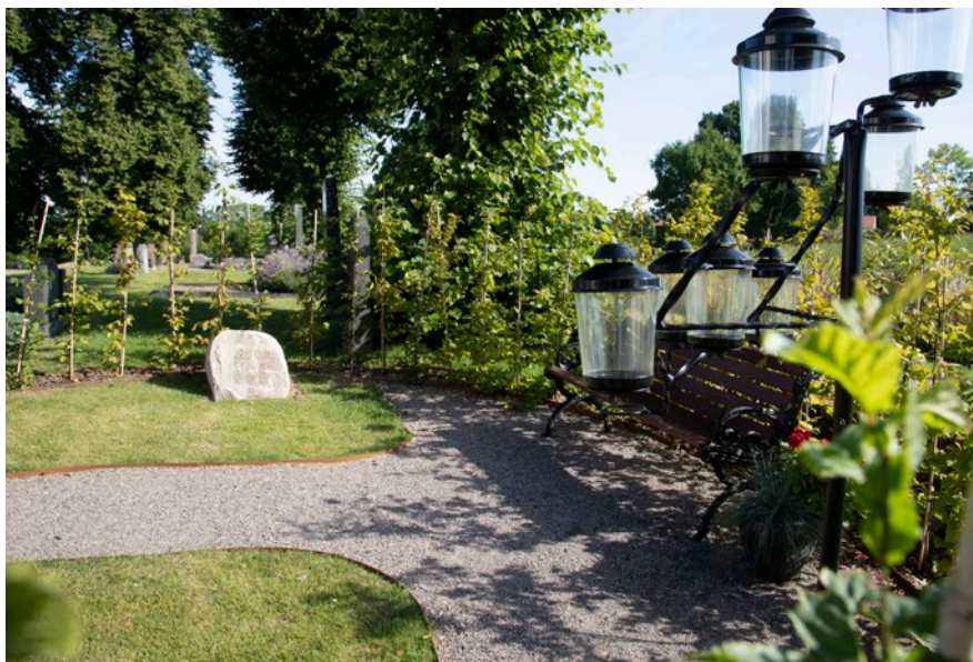
På Ugglums kyrkogård finns numera en liten minneslund och askgravlund.

De låg undanstopgade och riksantikvarieämbetet såg inget behov