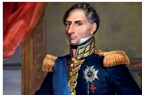
Karl XIV Johan var kung när kyrkan byggdes, vilket berättas på en tavla ovanför kyrkporten.